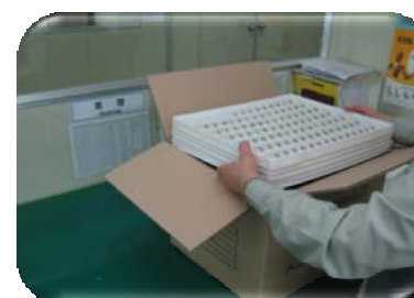
포장 및 출하